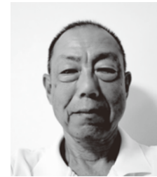
令和6年度 公益財団法人日本スポーツ協会公認スポーツ指導者等表彰受賞者