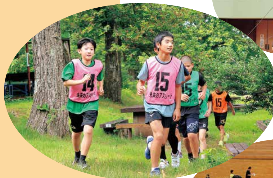
未来のアスリート発掘事業 「20期生・合宿プログラム」