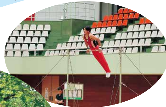
富山県民スポーツ大会 「体操競技」