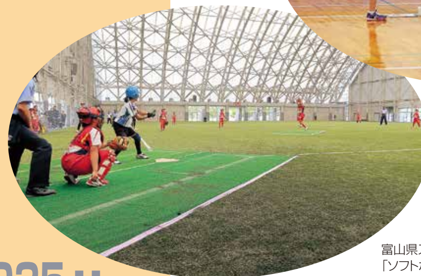
富山県スポーツ少年団競技別総合交流大会 「ソフトボール競技」