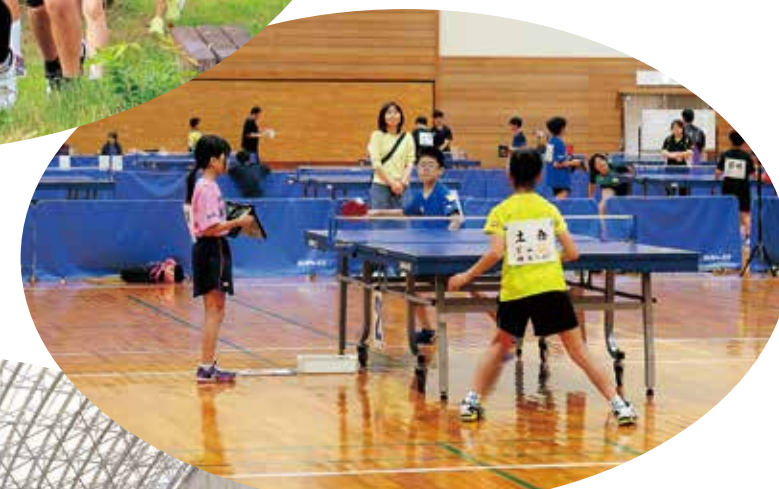
富山県スポーツ少年団競技別総合交流大会 「卓球競技」