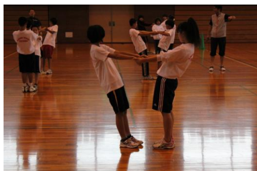
③ ②の最中に笛の合図でV字バランス