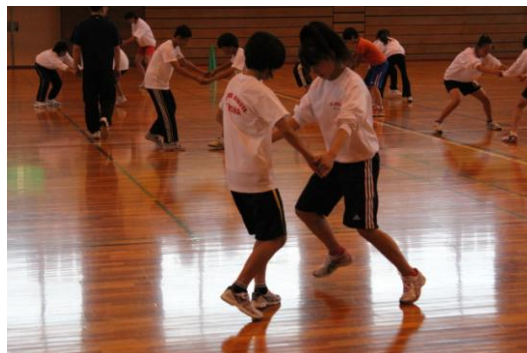
② 自分のつま先を踏ませずに相手のつま先を踏む