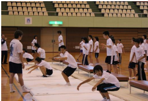
⑪台からジャンプし、両足で着地する