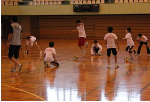
⑦転がって来たボールをケンケンジャンプをしながら跳び越える