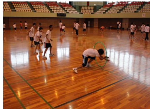
⑩転がってきたフープをくぐる。