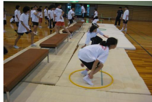
⑫フープの中に両足で着地する