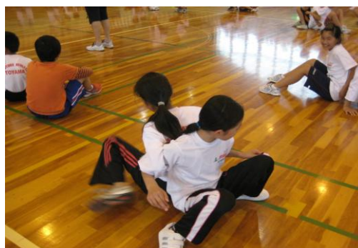
④ 背中合わせの状態から息を合わせて立ち上がる