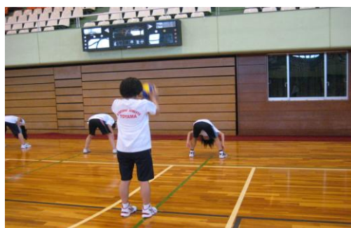
⑥ 股下からボールを見て、ワンバウンドしたボールをキャッチする