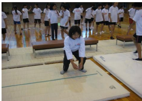
※両足着地の姿勢：腰の位置は、膝の位置より下になるように注意する