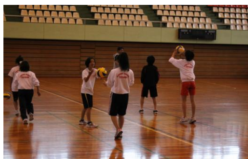
⑤ 背面から来たボールが目の前でワンバウンドしたらキャッチする