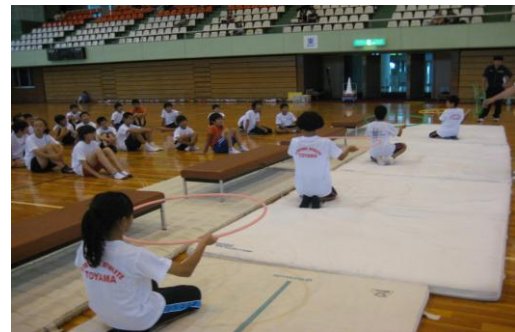
⑬高い位置にフープをセットし、その中に着地する