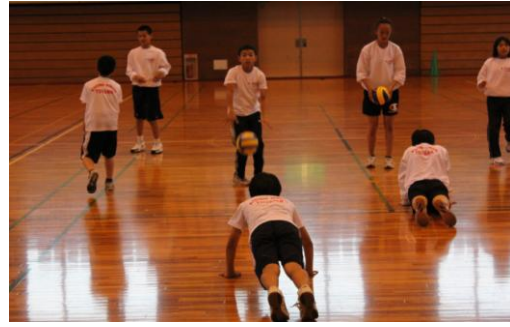
⑧腕立て姿勢からワンバウンドしたボールをキャッチする