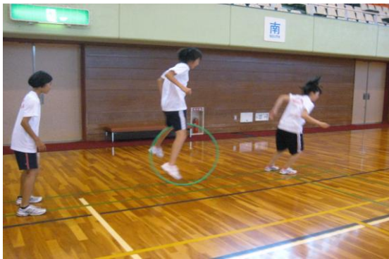
⑨転がってきたフープを跳び越える