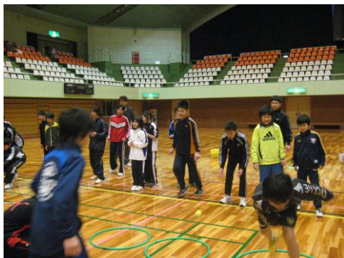
ボールを両足で持ち上げ、フープの中に入れる