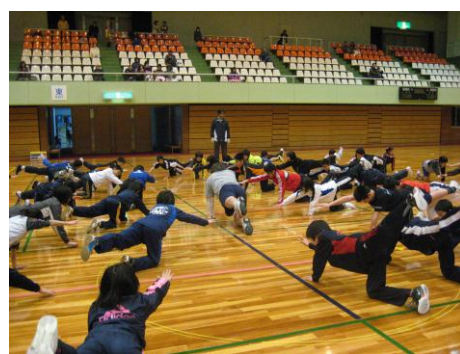
チャレンジカードの課題 2点指示バランス