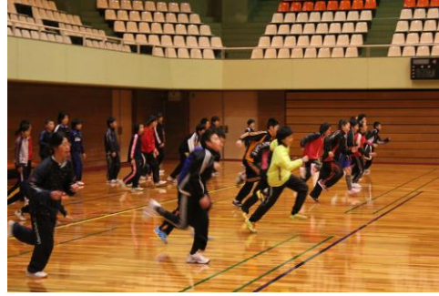
片足跳びでダッシュ