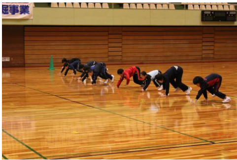
「ワニ歩き」+ダッシュ