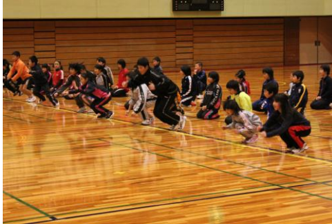
「正座」から合図でダッシュ