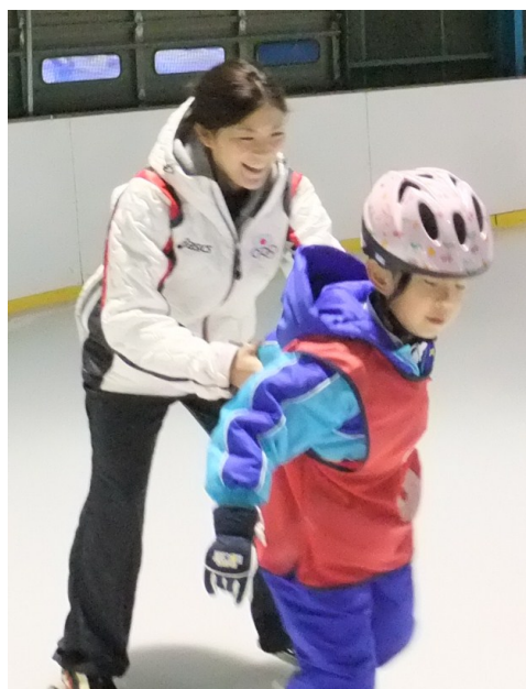
教え上手な穂積選手