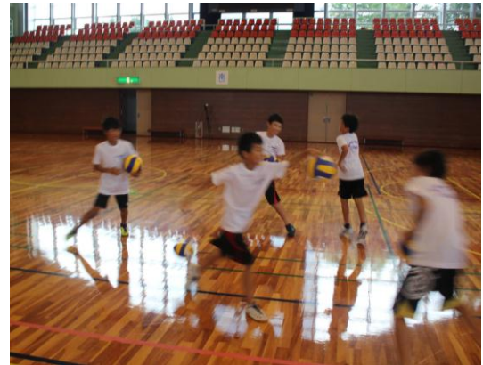
ボール送り（ワンバウンド）