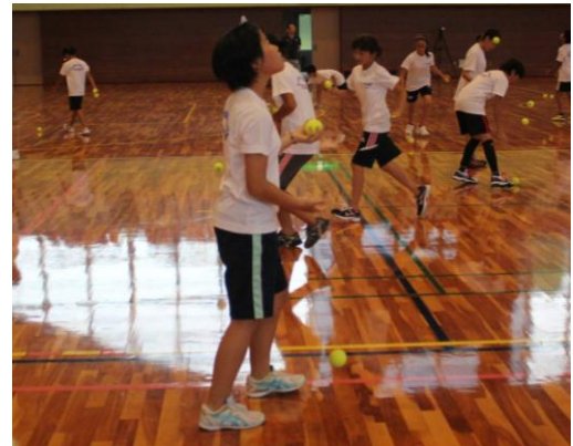
ボールキャッチ（ジャグリング）