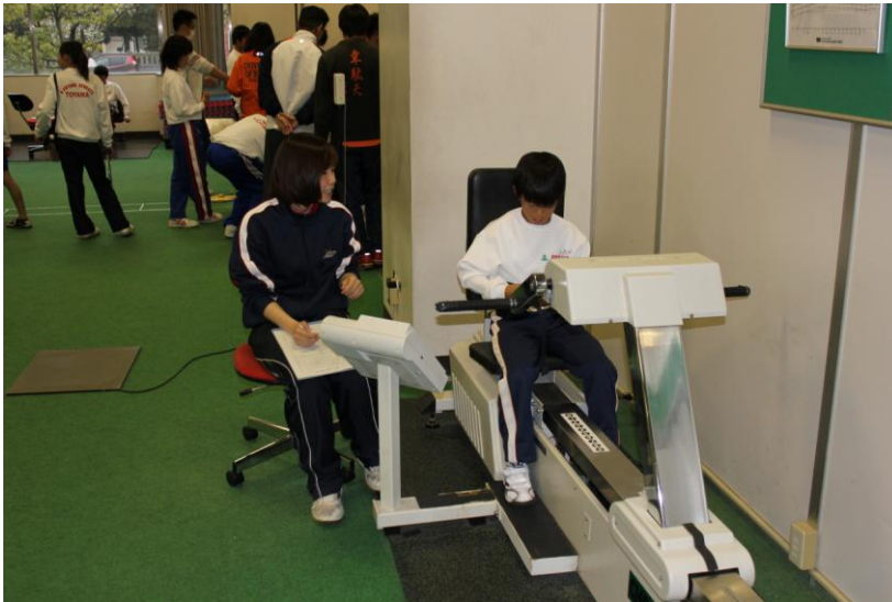
腕伸展パワーを測定しています。

次回の第5回育成プログラムは、5月22日（日）に実施します。 内容・時間・場所は、下記の通りです。