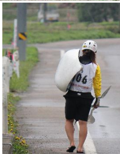
五十嵐川に特設で作られたコースのため、谷底に設けられたスタート地点までの移動に苦勞する選手たち