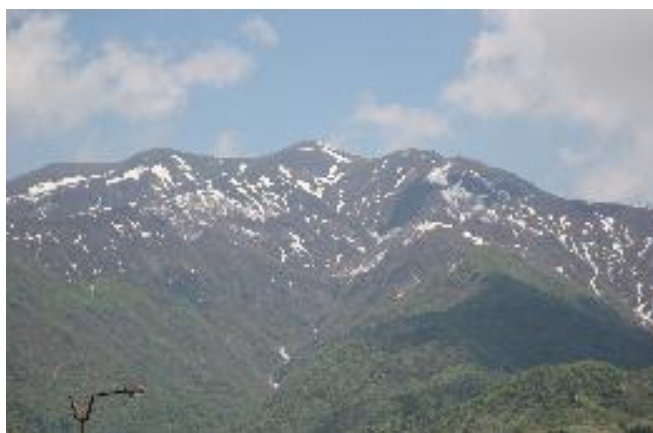
大会は、まだ残雪の残る新潟県三条市笠堀地区で開催された

第68回国民体育大会(スポーツ祭東京2013)を目指し、北信越国体が始まりました。5月12日(日)に開催されたカヌー競技スラローム種目・ワイルドウォーター種目の熱戦の様子を報告いたします。